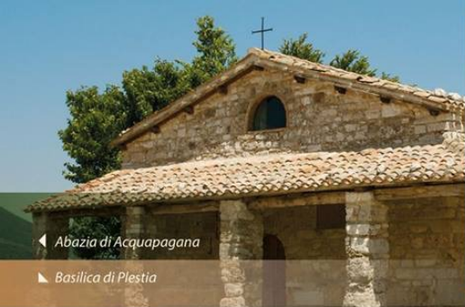
◀ Abazia di Acquapagana